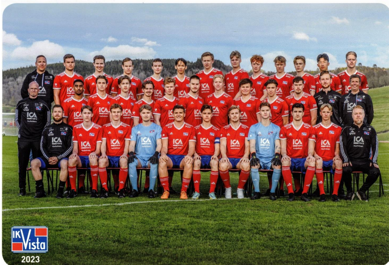
Bild: Herrlaget 2023 uppflyttade till division III