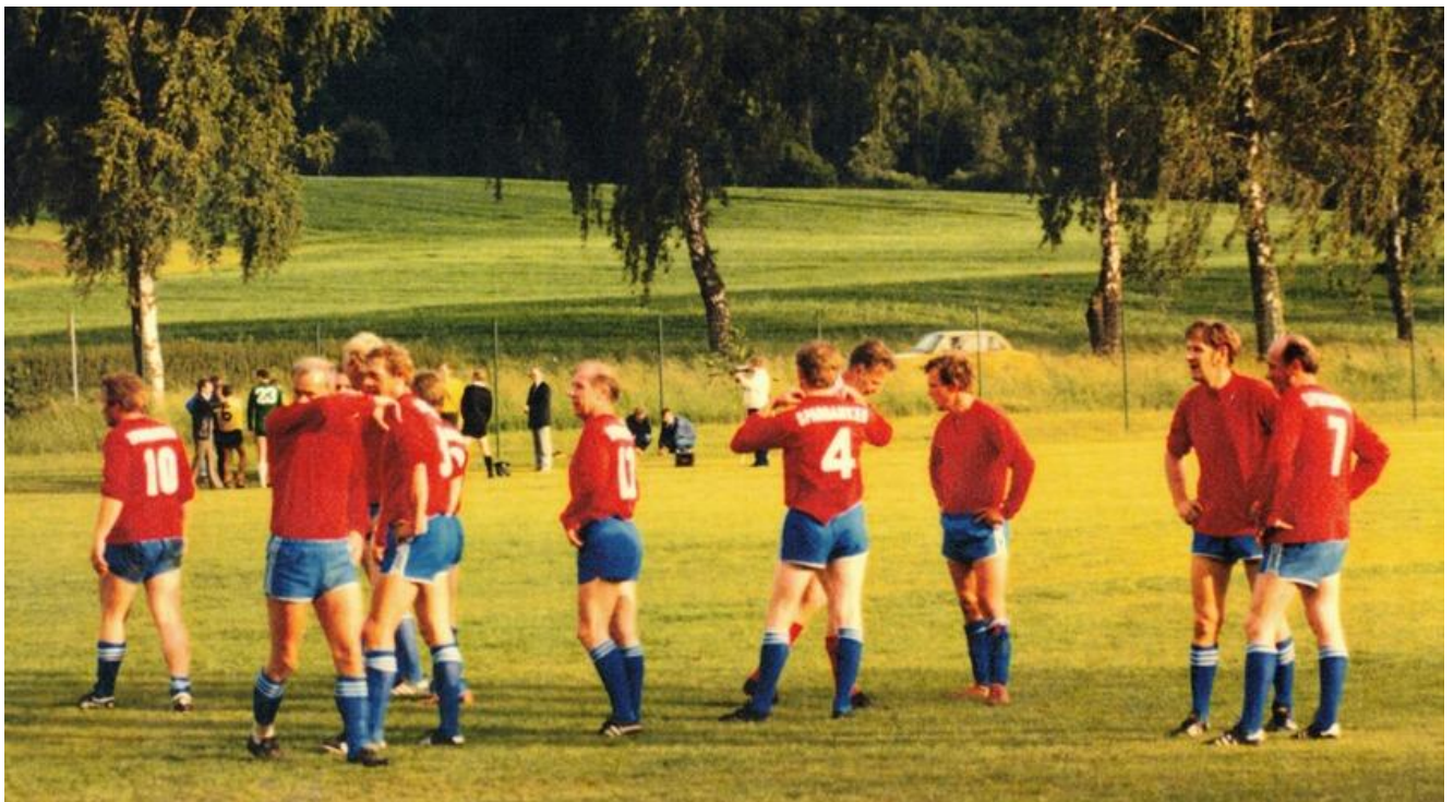
Här är några gamla veteraner. Du känner väl igen en del av dem!